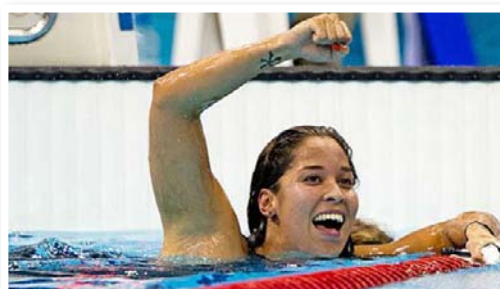
Ranomi Kromowidjojo (2011)