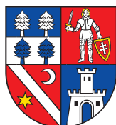
BANSKOBYSTRICKÝ SAMOSPRÁVNÝ KRAJ