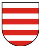
MESTO BANSKÁ BYSTRICA